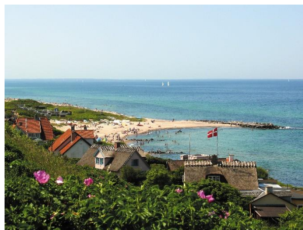
Den skønne udsigt over "Lejet"

Pris kr. 2.795 Alle værelser med håndvask. 19 toiletter og 14 badeværelser. Enkelte med bad/toilet. Tillæg kr. 350 Tillæg enkeltværelse kr. 400 Tilmelding: 48 70 76 36 – tisvildehoejskole@gmail.com www.tisvildehoejskole.dk