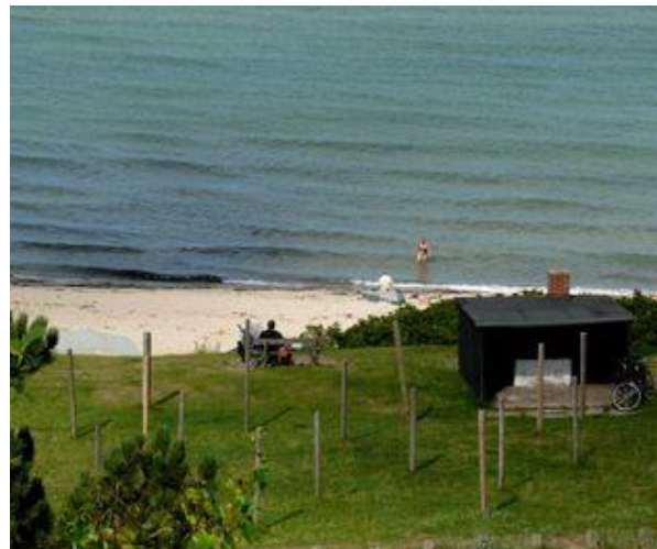
Udsigten fra redningsstationen.