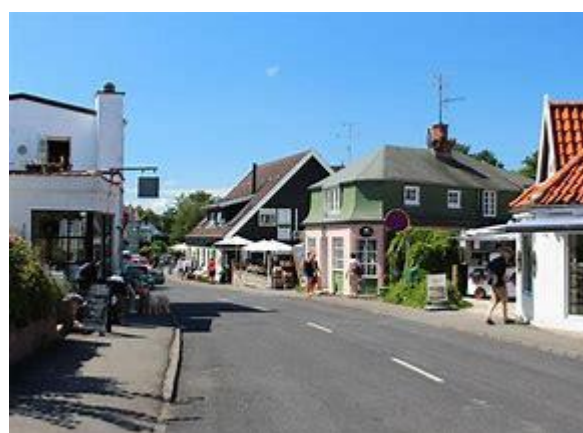
Det hyggelige Tisvildeleje.